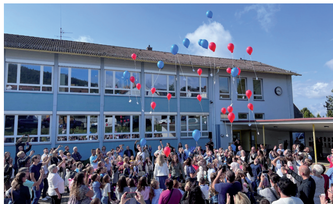
Einschulung Schule Waldprechtsweier

Nun hoffen wir am Donnerstag, 22.09.2022 auf strahlenden Sonnenschein, damit auch in Malsch rote, bunte und gelbe Luftballons in den Himmel steigen können.