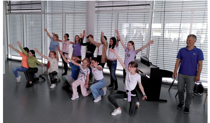
Begrüßung der neuen Fünftklässler am AMG

die Ganztagsbetreuung zu informieren, alle Hefte für ihre Kinder bereits an der Schule zu erwerben, eine Einführung in die digitale Lernplattform „Moodle“ zu erhalten oder sich bei einem Kuchen im Elterncafé der Klasse 6 untereinander auszutauschen. (söf)