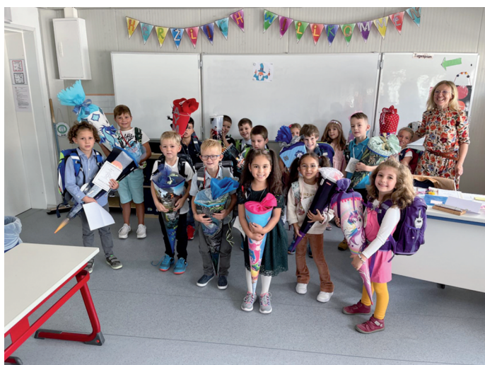
Klasse 1 a

Ein herzlicher Dank gilt allen Helferinnen und Helfern, die durch ihre Unterstützung diese schöne Feier erst möglich gemacht haben.