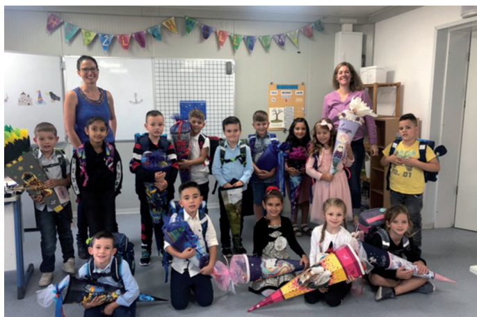
Klasse 1 b