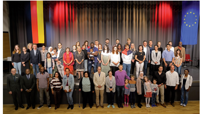
Gemeinsamer Abend: Die Neubürgerinnen und Neubürger des Landkreises Karlsruhe kamen am Donnerstag, 15. September 2022, im Alex Huber Forum in Forst bei der Einbürgerungsfeier zusammen.